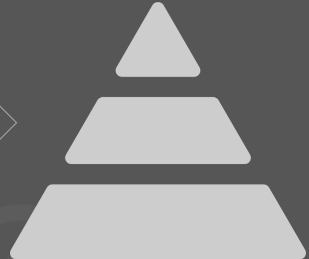
SOCIETAT DE CLASSES

S'apliquen nous canvis per tal de crear una societat més justa i mòbil.